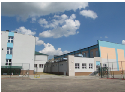
Zakończenie inwestycji – czerwiec 2013 roku