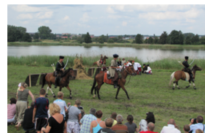
Na Letniej Akademii Wiedzy o Tatarach w Sokółce