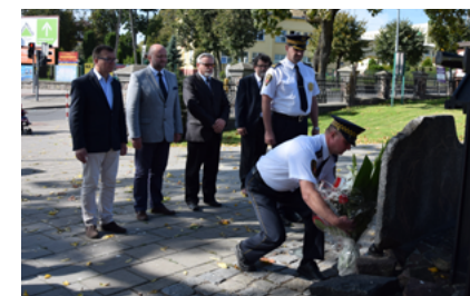
17 września 2014 roku. 75 lat po agresji sowieckiej na Polskę. Złożenie kwiatów pod Pomnikiem Zesłańców Sybiru w Sokółce.

Zawsze we wrześniu władze sokólskiej gminy zapraszają na Dożynki. Święto Zakończenia Plonów co roku organizowane jest w innym miejscu. W 2011 roku gospodarzem Dożynek była Stara Kamionka, w 2012 – Lipina, w 2013 – Parafia Wniebowzięcia NMP w Sokółce, natomiast w 2014 – Parafia św. Antoniego Padewskiego w Sokółce.