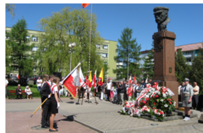
Obchody rocznicy uchwalenia Konstytucji 3 Maja

Władze Sokółki pamiętają też o tak bolesnych dla Polski rocznicach jak wybuch II wojny światowej, początek okupacji sowieckiej 17 września 1939 roku, katastrofa samolotu prezydenckiego w Smoleńsku.