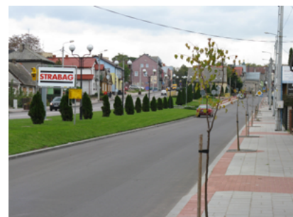
Ulica 1 Maja