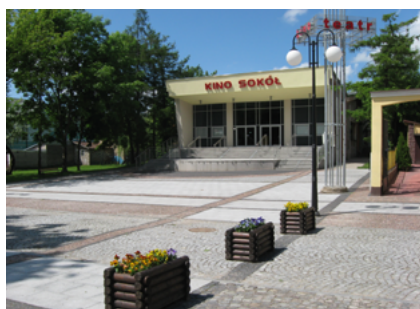
Kino w nowej odsłonie