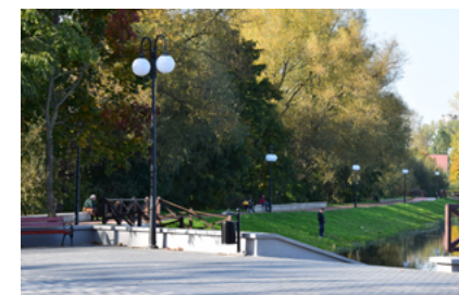
Otoczenie zalewu w Sokółce - po modernizacji