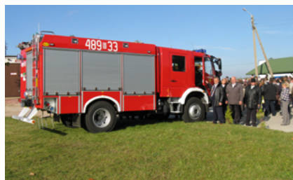
Wóz gaśniczy OSP w Starej Kaminionce