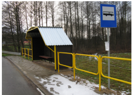
Przystanek w Wierzchłowcach

Przedstawiamy przykłady wydatkowania środków w ramach Funduszu Sołeckiego na terenie sokólskiej gminy.