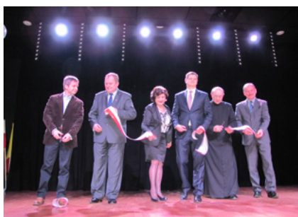
Oficjalne otwarcie kina „Sokół” – 28 lutego 2014 roku