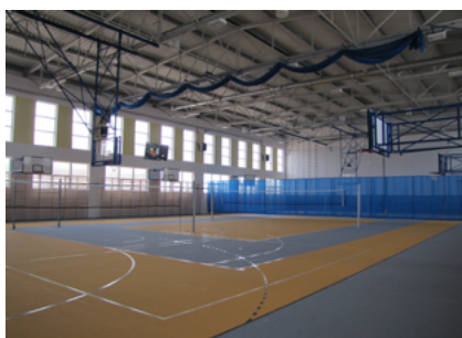
Tak prezentuje się nowa sala sportowa przy ZSI

Oddanie do użytku nowoczesnego obiektu sportowego zostało połączone z Wojewódzką Inauguracją Roku Szkolnego, którą zorganizowano w tym miejscu 2 września 2013 roku.