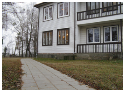
Chodnik przy Szkole Podstawowej w Geniuszach