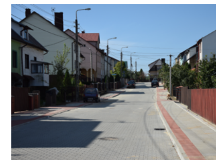
Ulica Armii Krajowej