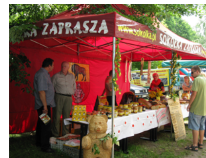
Festyn w Nowogrodzie – czerwiec 2012 roku