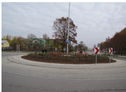
Sokółskie rondo im. Solidarności