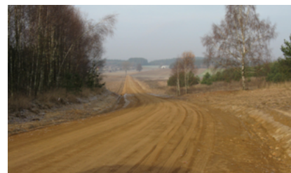
Droga Igręty - Wysokie Laski