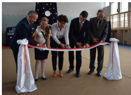
Przecięcie wstęgi w nowej sali sportowej przy ZSO 13 października 2014 roku