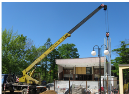
W czasie remontu – prace przed budynkiem kina „Sokół”

Kinomani w Sokółce mogą liczyć na najwyższą jakość dźwięku i obrazu. Najwyższą jakość projekcji zapewnia sala wyposażona w system dźwięku dolby digital, a także cyfrowy projektor, który umożliwi oglądanie filmów w technologii 3D.