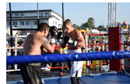
Impreza plenerowa „Pożegnanie Lata”