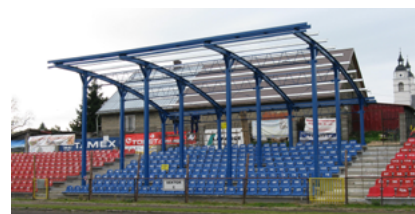
Zadaszenie sektora trybun - OSiR w Sokółce