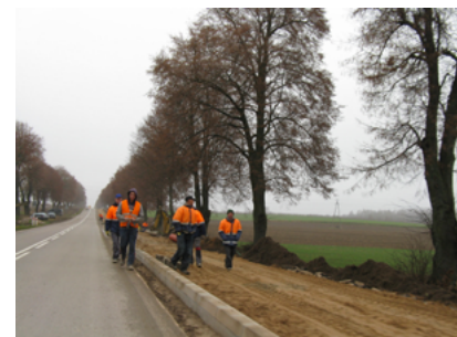
Budowa ścieżki rowerowej przy drodze Sokółka – Kryniki

19. Budowa ścieżki rowerowej przy drodze wylotowej z Sokółki w kierunku Krynek. Była to wspólna inwestycja Gminy Sokółka i Urzędu Marszałkowskiego. Budowa ścieżki kosztowała 190 tys. zł, z czego 70 proc. sfinansował Podlaski Zarząd Dróg Wojewódzkich, natomiast pozostałą kwotę – Urząd Miejski w Sokółce. Pierwszy odcinek ścieżki wzdłuż drogi wojewódzkiej w kierunku Krynek wykonano w 2008 roku. Ścieżka kończyła się wówczas na wysokości cmentarza katolickiego. W 2013 roku trasa dla rowerzystów i dla pieszych została przedłużona do drogi powiatowej na Drahle. Nowa ścieżka to odcinek o długości ok. 400 m i szer. 3,5 m.