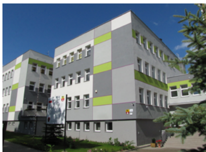
Gimnazjum nr 1 im. w Sokółce po remoncie