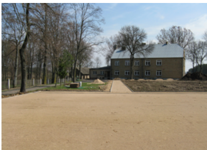
Inwestycja przy Szkole Podstawowej w Malawiczach – w trakcie i po realizacji