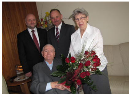
92 urodziny Honorowego Obywatela Sokółki 13 kwietnia 2014 roku