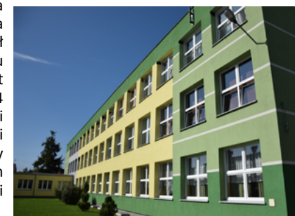
Zespół Szkół Ogólnokształcących w Sokółce

W trakcie kadencji 2010 – 2014 Gmina Sokółka zrealizowała projekt „Termomodernizacja budynków szkolnych w Sokółce: Zespołu Szkół Ogólnokształcących na Osiedlu Zielonym, Zespołu Szkół Integracyjnych oraz Gimnazjum nr 1”. Koszt projektu zamknął się w kwocie 3 mln 923 tys. 364 zł. Inwestycję finansowano z trzech źródeł: dotacji bezzwrotnej (1 mln 107 tys. 210 zł) oraz pożyczki (913 tys. 710 zł) z Narodowego Funduszu Ochrony Środowiska i Gospodarki Wodnej w ramach Programu „System Zielonych Inwestycji GIS” i środków budżetowych gminy Sokółka.