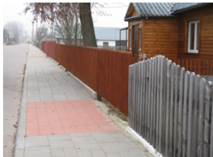
Chodnik w Orłowiczach