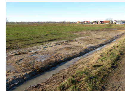
Budowa wodociągu wiejskiego