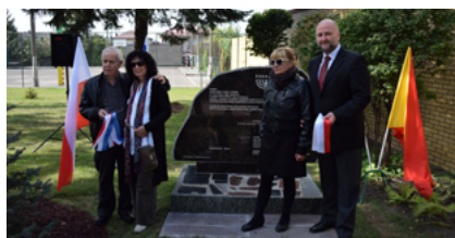
Odsłonięcie Pomnika Ofiar Holokaustu przy Zespole Szkół Integracyjnych w Sokółce

osób. Ostateczna likwidacja sokólskiego getta nastąpiła 24 stycznia 1943 roku. Żydzi trafili do obozu w Kiełbasinie pod Grodnem. Stamtąd ruszyły transporty do Treblinki i Auschwitz.