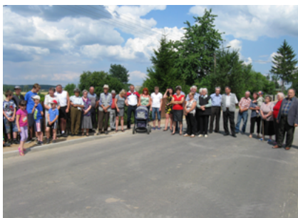
Nowy asfalt w Bobrownikach