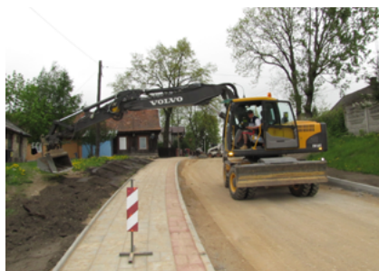
Ulica Roski Małe podczas inwestycji