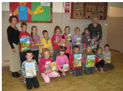
Wychowankowie Szkoły Podstawowej w Boguszach z pomocami dydaktycznymi zakupionymi w ramach projektu „Szkoła z klasą”

14. „Szkoła z klasą” realizowany okresie od 2 stycznia 2012 do 30 czerwca 2013 roku w ramach Program Operacyjny Kapitał Ludzki; współfinansowany w całości przez Unię Europejską ze środków EFS; budżet projektu wynosił 405 tys. 800 zł. W projekcie uczestniczyło 635 uczniów. Zrealizowanych było około 7 tys. godzin zajęć dodatkowych. Celem głównym projektu: wsparcie indywidualnego rozwoju uczniów i uczennic klas I-III w 9 publicznych szkołach podstawowych, dla których organem prowadzącym jest Gmina Sokółka poprzez zorganizowanie dodatkowych zajęć: zajęcia dla dzieci z trudnościami w czytaniu i pisaniu, z trudnościami w zdobywaniu umiejętności matematycznych, zajęcia logopedyczne, gimnastyka korekcyjna, zajęcia rehabilitacyjne, socjoterapeutyczne, psychologiczno-pedagogiczne, rozwijające zainteresowania: koło matematyczno-przyrodnicze, humanistyczne, teatralne, teatralno-taneczne, język angielski. W ramach projektu zakupiono pomoce dydaktyczne na kwotę 73 tys. 960 zł.