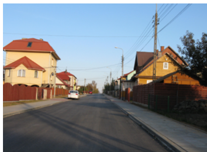
Ulica Sportowa i Żytnia