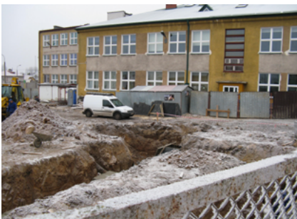
Początek budowy sali przy Zespole Szkół Integracyjny - grudzień 2011 roku

Boisko główne sali przy ZSI ma wymiary 40x20 m, co umożliwi organizację rozgrywek na poziomie krajowym piłki nożnej halowej, ręcznej i koszykówki. Ruchome trybuny mieszczą 200 osób. Powierzchnia użytkowa sali wynosi 1.555,4 m kw.