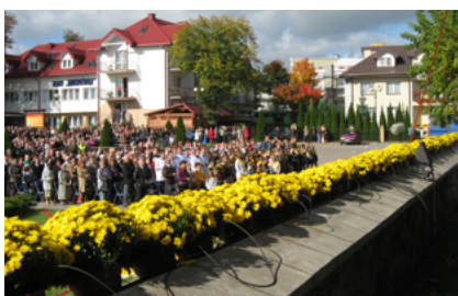
Uroczystości związane z przeniesieniem Cudownej Hostii do kościoła pw. św. Antoniego Padewskiego w Sokółce

Sokółka jest gminą, gdzie regularnie organizowane są modlitwy ekumeniczne o pokój i sprawiedliwość na świecie. Uczestniczą w nich przedstawiciele katolików, prawosławnych, muzułmanów, Żydów. Pierwsza modlitwa ekumeniczna odbyła się w październiku 2012 roku przy Pomniku Wielokulturowości w Sokółce.