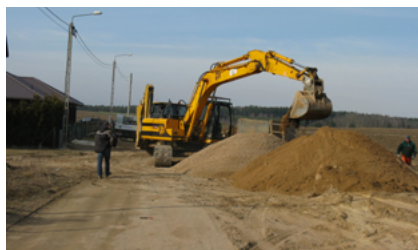
Budowa kanalizacji sanitarnej Żwirki i Wigury