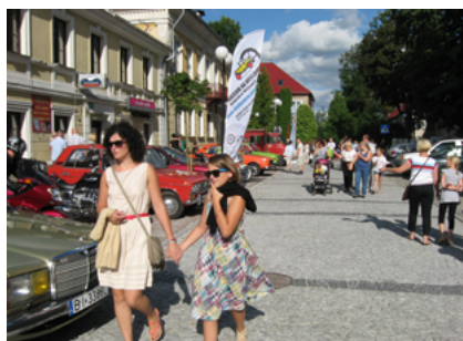
Uliczka w nowej odstonie