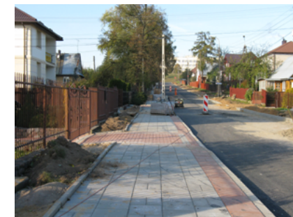
Ulica 3 Maja