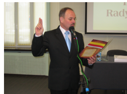
Burmistrz złożył ślubowanie 6 grudnia 2010 roku