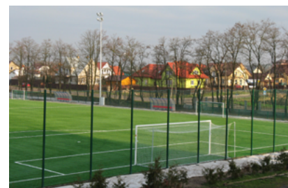
Kompleks boisk w Sokółce

- Projekt „Budowa kompleksu boisk sportowo-rekreacyjnych przy Ośrodku Sportu i Rekreacji w Sokółce” zrealizowany w 2009 roku. Projekt współfinansowany z Europejskiego Funduszu Rozwoju Regionalnego w ramach Regionalnego Programu Operacyjnego Województwa Podlaskiego na lata 2007-2013 – wartość projektu 4 mln 264 tys. 186 zł, z czego kwota dofinansowania to 2 mln 132 tys. 93 zł. Obiekt otrzymał im. Piotra Nurowskiego – Prezesa Polskiego Komitetu Olimpijskiego, tragicznie zmarłego w katastrofie samolotu prezydenckiego pod Smoleńskiem 10 kwietnia 2010 roku.