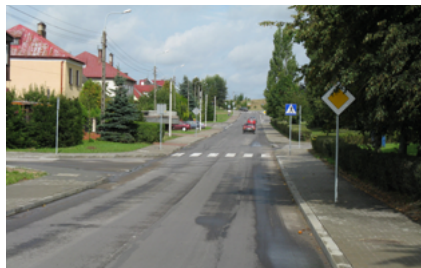
ul. Lotników Lewoniewskich w Sokółce