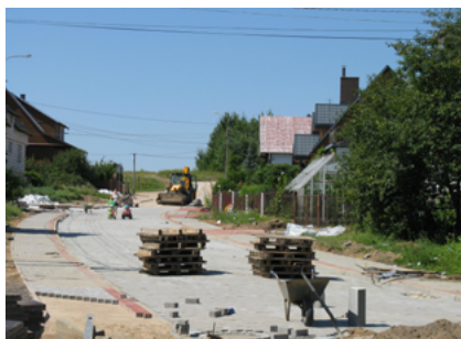
Ulica Królowej Bony w trakcie remontu