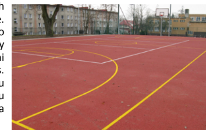
Boisko Orlik przy ZSO w Sokółce

- Budowa boisk sportowych w ramach Programu „Moje Boisko – Orlik 2012” w Sokółce. W wyniku realizacji projektu wybudowano boisko do piłki nożnej o nawierzchni z trawy syntetycznej i boisko wielofunkcyjne o nawierzchni poliuretanowej. Wartość inwestycji 1 mln 14 tys. zł, w tym dofinansowanie z Ministerstwa Sportu i Turystyki w wysokości 333 tys. zł i Samorządu Województwa w wysokości 333 tys. zł. Inwestycja została zrealizowana w 2009 roku.