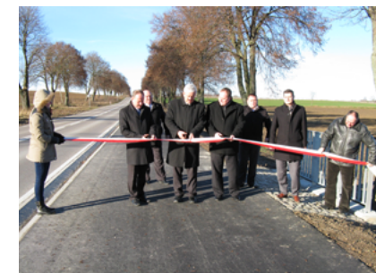
Otwarcie nowej ścieżki - grudzień 2013 roku

20. Modernizacja w budynkach Biblioteki Publicznej w Sokółce - 70 tys. zł, z czego 40 tys. zł to środki z Ministerstwa Kultury i Dziedzictwa Narodowego (z Programu Infrastruktura Bibliotek). 30 tys. zł pochodziło z budżetu Gminy Sokółka. W ramach inwestycji wykonano: w bibliotece głównej – podjazd dla niepełnosprawnych, nowe schody, wymiana stolarki okiennej i drzwiowej oraz posadzki w wiatrołapie i sali wystawowej; w Oddziale Bibliotecznym dla Dzieci – wymiana stolarki okiennej i drzwiowej, malowanie ścian; Filia Biblioteczna nr 1 i nr 2 w Sokółce – malowanie ścian.