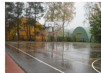
Boiska przy Szkole Podstawowej w Geniuszach