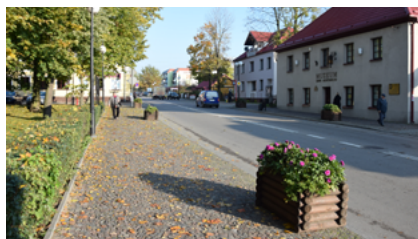
Ulica Piłsudskiego w Sokółce

- Projekt „Usprawnienie układu komunikacyjnego Gminy Sokółka – przebudowa ulic Witosa, Piłsudskiego i Wróblewskiego oraz drogi gminnej Stara Kamionka – Bobrowniki o łącznej dł. 5,276 km” zrealizowany w 2009 roku. Projekt współfinansowany z Europejskiego Funduszu Rozwoju Regionalnego w ramach Regionalnego Programu Operacyjnego Województwa Podlaskiego na lata 2007-2013; wartość projektu 7 mln 25 tys. 774 zł, kwota dofinansowania 3 mln 839 tys. 684 zł.