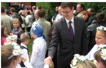
Na Dożynkach Gminnych w latach 2010 - 2014

2 października 2011 roku oczy całego świata były skierowane na Sokółkę. Tego dnia odbyła się uroczystość związana z przeniesieniem Hostii przemienionej w Częstkę Ciała Pańskiego z plebanii do kaplicy Matki Bożej Różańcowej w kościele pw. św. Antoniego Padewskiego w Sokółce. W przygotowaniu uroczystości pomogły władze sokólskiej gminy. Uczestnicy mszy po raz pierwszy zobaczyli wówczas Cudowną Hostię. Historia miała swój początek jesienią 2008 roku, kiedy to ksiądz udzielający komunii upuścił jeden z komunikantów na posadzkę świątyni. Hostię umieszczono w naczyniu liturgicznym z wodą, gdzie miała się rozpuścić. Tak się jednak nie stało. Na hostii zauważono czerwony skrżep. Po zbadaniu próbek, patomorfologzy stwierdzili, że to fragment tkanki żywego mięśnia sercowego człowieka w stanie agonalnym. Sprawa sokólskiego cudu była badana przez komisję ekspertów powołanych przez Metropolitę Białostockiego. Nie doszukano się w niej działania osób trzecich. Od chwili wystawienia Cudownej Hostii na widok publiczny, do kościoła pw. św. Antoniego Padewskiego zmierza coraz więcej pielgrzymów. W specjalnej księdze zapisywane są relacje o uzdrowieniach i duchowej przemianie.