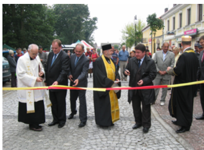
Uroczyste przecięcie wstęgi na wyremontowanej uliczce