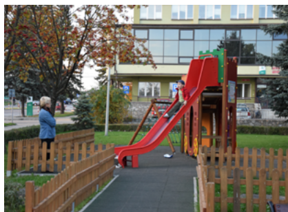
Nowy plac zabaw w Sokółce