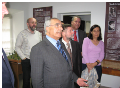
Goście z Maroka w Muzeum Ziemi Sokólskiej