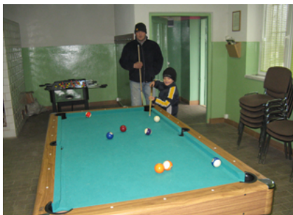
Wyposażenie Klubu Wiejskiego w Żukach