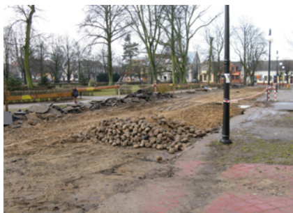
W trakcie inwestycji