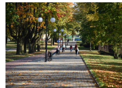
Malownicza alejka przy ulicy Kryńskiej