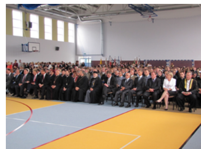
Uczestnicy Wojewódzkiej Inauguracji Roku Szkolnego w Sokółce – 2 września 2013 roku