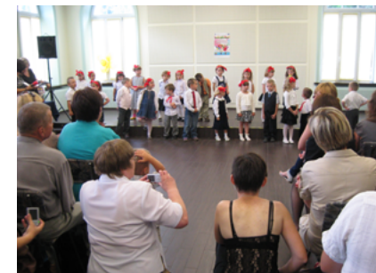
Podsumowanie projektu „Dobry start w Klubach Przedszkolaka”