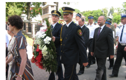
W rocznicę Cudu nad Wisłą