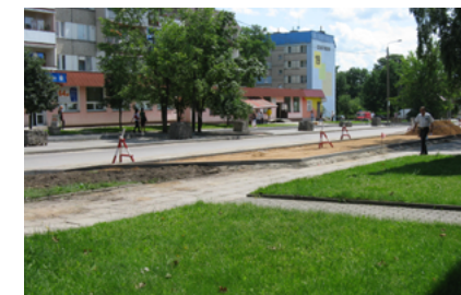
Ulica Piłsudskiego w trakcie inwestycji

- Projekt „Budowa kompleksu boisk sportowo-rekreacyjnych przy Ośrodku Sportu i Rekreacji w Sokółce” zrealizowany w 2009 roku. Projekt współfinansowany z Europejskiego Funduszu Rozwoju Regionalnego w ramach Regionalnego Programu Operacyjnego Województwa Podlaskiego na lata 2007-2013 – wartość projektu 4 mln 264 tys. 186 zł, z czego kwota dofinansowania to 2 mln 132 tys. 93 zł. Obiekt otrzymał im. Piotra Nurowskiego – Prezesa Polskiego Komitetu Olimpijskiego, tragicznie zmarłego w katastrofie samolotu prezydenckiego pod Smoleńskiem 10 kwietnia 2010 roku.