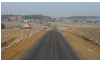
Droga Janowszczyzna - Planteczka