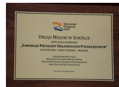
Jesteśmy Samorządem Przyjaznym Organizacjom Pozarządowym