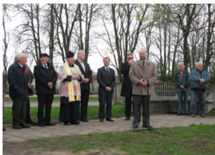
Przed pomnikiem Braci Ejsmontów nad sokólskim zalewem