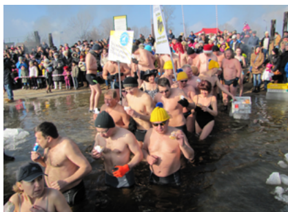
Tłusta Niedziela z Morsami i Pączkami w Sokółce

W kalendarzu imprez Gminy Sokółka każdy znajdzie coś dla siebie. Propozycją dla amatorów zimowych klimatów jest organizowana w lutym Tłusta Niedziela z Morsami i Pączkami. Na słodkie zakończenie karnawału połączone z kąpielą w przeręblu zjeżdżają nad sokólskie jezioro tłumy morsów z całej północno – wschodniej Polski. Tłusta Niedziela organizowana jest w Sokółce od 2013 roku.