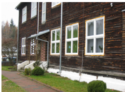
Nowe okna w Niepublicznej Szkole Podstawowej w Lipinie