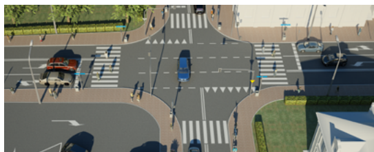
Skrzyżowanie ul. Grodzieńskiej z ul. Piłsudskiego i Placem Kościuszki po przebudowie

W 2014 roku rozpoczęły się prace przygotowawcze do przebudowy skrzyżowania ul. Grodzieńskiej z ul. Piłsudskiego i Placem Kościuszki w Sokółce. Inwestycję poprowadzi Generalna Dyrekcja Dróg Krajowych i Autostrad. Przygotowania do realizacji zadania trwały siedem lat. Na każdym etapie sokółska Gmina czynnie włączała się w proces inwestycyjny. Przewidywany koszt zadania to 2 mln zł. Po przebudowie powstanie nowoczesne skrzyżowanie z sygnalizacją świetlną i lewoskrętami z drogi krajowej.