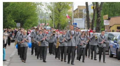
Miejska Orkiestra Dęta z Sokółki