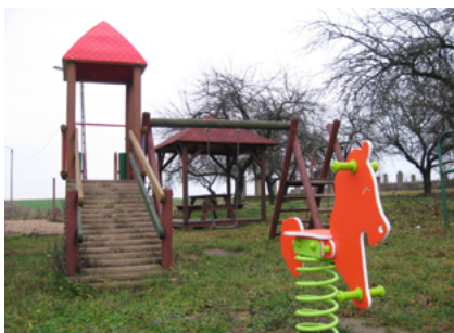
Plac zabaw w Drahlach