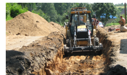
Budowa kanalizacji ulica Roski Małe