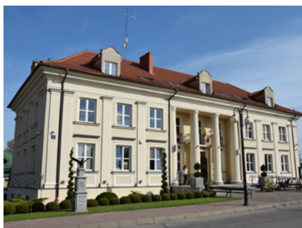
Siedziba Urzędu Miejskiego w Sokółce

Urząd Miejski w Sokółce to wielokrotnie zwycięzca rankingu na najtańszy urząd w Polsce. Organizowany przez dwutygodnik „Wspólnota” ranking dotyczy najniższych wydatków bieżących na administrację w przeliczeniu na 1 mieszkańca. Zestawienie opracowują naukowcy z Uniwersytetu Warszawskiego. Sokółka od 2002 roku nieprzerwanie zajmuje w tymże zestawieniu pierwsze lub drugie miejsce w kategorii miast powiatowych liczących 20 – 30 tys. mieszkańców. Świadczy to o wysokiej jakości usług, bez niepotrzebnego generowania kosztów.