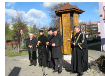
Modlitwa o pokój na świecie Sokółka 2012 roku

Sokółka jest gminą, gdzie regularnie organizowane są modlitwy ekumeniczne o pokój i sprawiedliwość na świecie. Uczestniczą w nich przedstawiciele katolików, prawosławnych, muzułmanów, Żydów. Pierwsza modlitwa ekumeniczna odbyła się w październiku 2012 roku przy Pomniku Wielokulturowości w Sokółce.