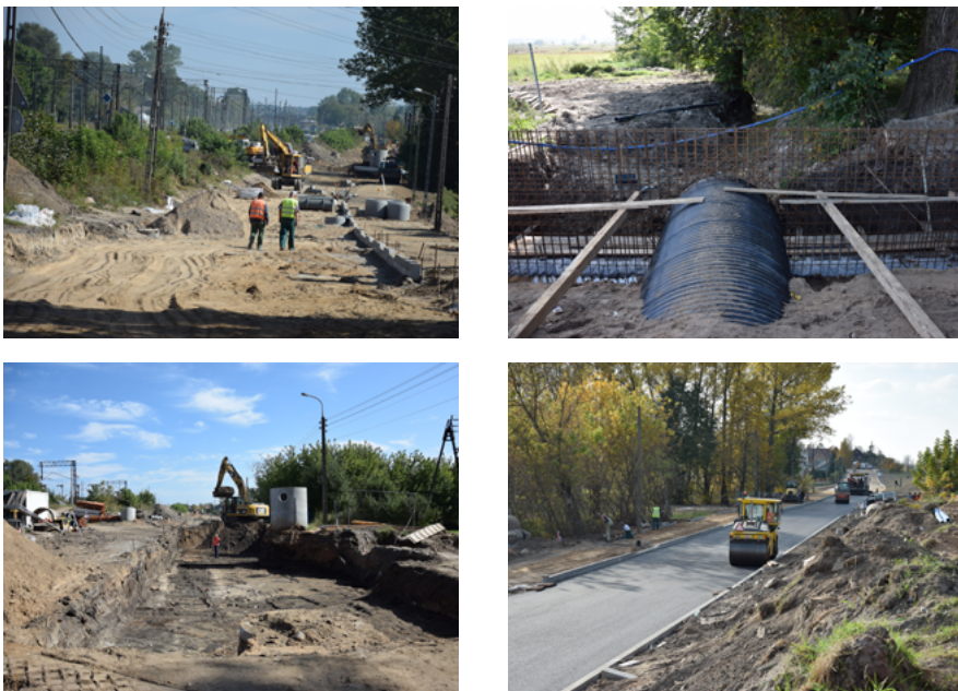
Remont ulic Marii Curie Skłodowskiej i Nowej w Sokółce

system kanalizacji deszczowej, oświetlenie uliczne, ciąg pieszo – rowerowy oraz nawierzchnia bitumiczna, dostosowaną do ruchu ciężkich pojazdów wraz z barierą energochłonną od strony nasypu kolejowego.