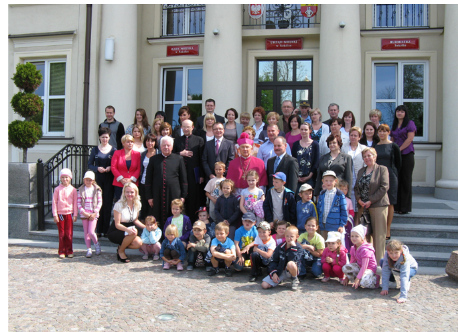
Wspólne zdjęcie z Metropolitą Białostockim przed Urzędem Miejskim w Sokółce

10 maja 2012 roku w Urzędzie Miejskim w Sokółce złożył wizytę Metropolita Białostocki Arcybiskup Edward Ozorowski. Na spotkaniu z pracownikami magistratu Dostojny Gość powiedział: Mówi się, że na 1000 osób zaledwie pięć ma ciekawe pomysły. Trzeba robić wszystko, aby te pięć osób pracowało w waszym urzędzie. Dziękuję za przyjęcie i życzę, aby nasza przyszłość była na miarę naszych wymagań.