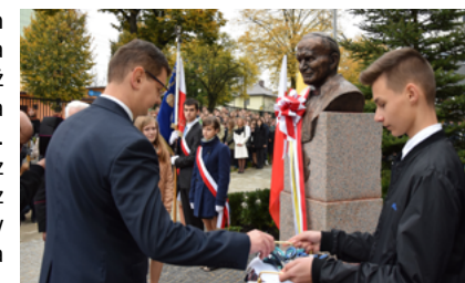
Na chwilę przed przecięciem wstęgi