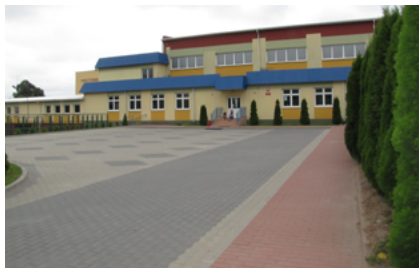
Sala sportowa przy SP nr 1 w Sokółce

- W 2010 roku rozpoczął się remont kina „Sokół”, który trwał do stycznia 2014 roku. Prace wykonano w ramach projektu „Modernizacja budynku Kina Sokół w Sokółce – sala multifunkcyjna z amfiteatrem zewnętrznym do aktywnego udziału w kulturze i turystyce” w ramach Regionalnego Programu Operacyjnego Województwa Podlaskiego na lata 2007 - 2013. Wartość projektu to 4 mln 279 tys. 914 zł, z czego dotacja Unii Europejskiej wyniosła 2 mln 286 tys. 194 zł.