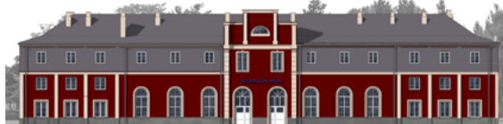
Tak ma wyglądać dworzec PKP w Sokółce

Od lutego 2014 roku Gmina Sokółka jest właścicielem zabytkowego dworca PKP. Budynek został przekazany nieodpłatnie aktem notarialnym przez spółkę PKP Nieruchomości. Razem z dworcem Gmina Sokółka stała się też właścicielem działki o powierzchni 1,12 ha, która sąsiaduje ze wspomnianym obiektem. Przymiarki do przejęcia dworca trwały kilka lat.