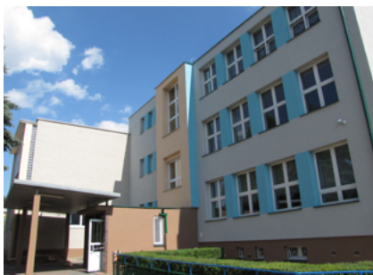
Nowa elewacja Zespołu Szkół Integracyjnych w Sokółce