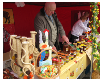
Stoisko Gminy Sokółka na Jarmarku w Piasecznie kwiecień 2011 roku

W ciągu czterech minionych lat Gmina Sokółka wielokrotnie uczestniczyła w plenerowych imprezach promocyjnych. Wzięliśmy udział m.in. w prezentacji Spotkanie Regionów, zorganizowanej w kwietniu 2011 roku w Piasecznie. Wystawiliśmy też swoje stoisko na Jarmarku w Nowogrodzie w czerwcu 2012 roku. Sokółka była uczestnikiem Parady, jaką w kwietniu 2013 roku zorganizowano w Białymstoku z okazji obchodów 500-lecia Województwa Podlaskiego.