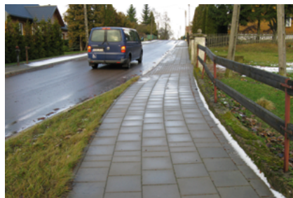
Chodniki w Boguszach

Odbyły się wybory zarządów i przewodniczących zarządów osiedli w mieście Sokółka.