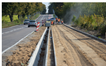
Chodnik ze ścieżką rowerową w kierunku Kraśnian