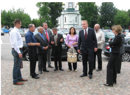
Marokańscy w centrum Sokółki