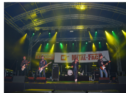
Na Dniach Sokółki