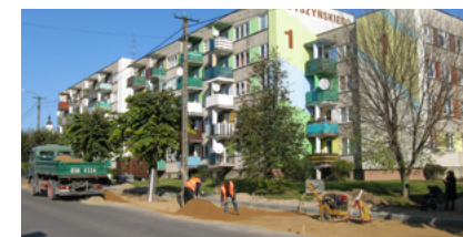
Remont parkingów i chodników - Wyszyńskiego