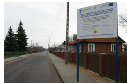
Droga gminna w Starej Kamionce