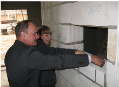
Wmurowanie aktu erekcyjnego – październik 2012 roku