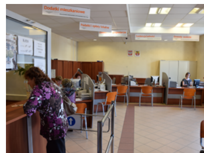
Sala Obsługi Interesantów w Urzędzie Miejskim w Sokółce

W październiku 2014 roku Urząd Miejski w Sokółce zdobył tytuł Samorządu Przyjaznego Organizacjom Pozarządowym w konkursie zorganizowanym przez Wojewodę Podlaskiego, Ośrodek Wspierania Organizacji Pozarządowych oraz Podlaską Siecią Pozarządową. Była to pierwsza edycja tego konkursu, którego celem jest promocja samorządów, wyróżniających się we współpracy z organizacjami pozarządowymi.