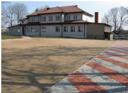
Boiska przy Szkole Podstawowej w Boguszach w czasie budowy