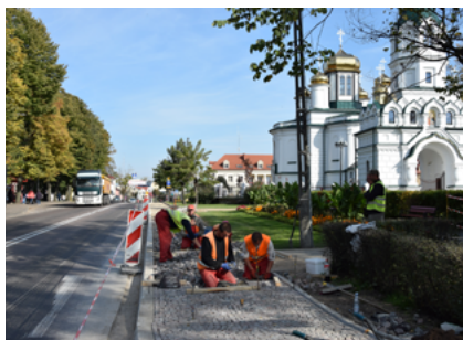
Inwestycje w centrum miasta - wrzesień 2014