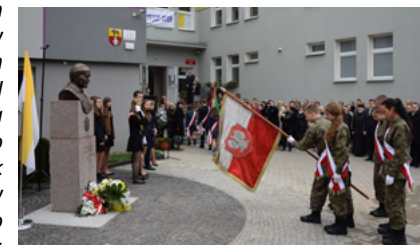
Pomnik Jana Pawła II ustawiono przed wejściem do sokólskiego Gimnazjum