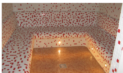
Nowe sauny na sokólskim basenie