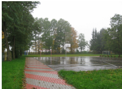
Boiska przy Szkole Podstawowej w Boguszach po zakończeniu inwestycji