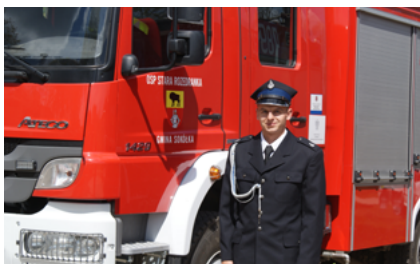
Wóz gaśniczy OSP w Starej Rozedrance