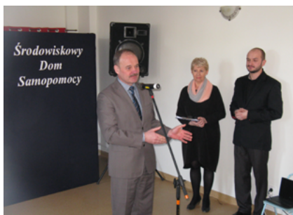
Na otwarciu nowej siedziby Środowiskowego Domu Samopomocy w Sokółce

15. Remont pomieszczeń (parter) budynku Przedszkola nr 5 na potrzeby Środowiskowego Domu Samopomocy w Sokółce. Pierwotnie placówka mieściła się w kamienicy należącej do Zakładu Gospodarki Komunalnej i Mieszkaniowej przy Placu Kościuszki w Sokółce. Pracownicy i ich podopieczni mieli do wykorzystania powierzchnię 96 m kw. Pomieszczenia zajmowane przez ŚDS w nowej siedzibie to 311 m kw. Całkowity koszt inwestycji to 1 mln 22 tys. 135 zł, z czego 640 tys. to wkład pozyskany z dotacji celowych z Budżetu Państwa. Pozostałe środki pochodzą z gminnego budżetu.