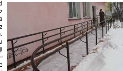
Podjazd dla niepełnosprawnych przy budynku Biblioteki Publicznej w Sokółce

20. Modernizacja w budynkach Biblioteki Publicznej w Sokółce - 70 tys. zł, z czego 40 tys. zł to środki z Ministerstwa Kultury i Dziedzictwa Narodowego (z Programu Infrastruktura Bibliotek). 30 tys. zł pochodziło z budżetu Gminy Sokółka. W ramach inwestycji wykonano: w bibliotece głównej – podjazd dla niepełnosprawnych, nowe schody, wymiana stolarki okiennej i drzwiowej oraz posadzki w wiatrołapie i sali wystawowej; w Oddziale Bibliotecznym dla Dzieci – wymiana stolarki okiennej i drzwiowej, malowanie ścian; Filia Biblioteczna nr 1 i nr 2 w Sokółce – malowanie ścian.