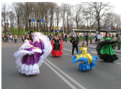
Reprezentacja Gminy Sokółka podczas Parady Województwa Podlaskiego w Białymstoku kwiecień 2013 roku