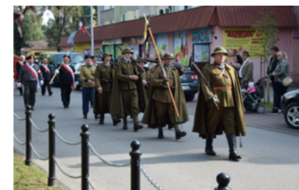
Grupa Rekonstrukcyjna Podhalańczyków, Sokółka wrzesień 2014 roku