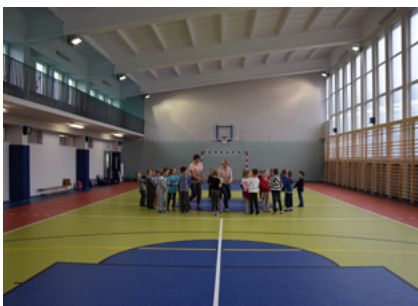
Sala sportowa przy Zespole Szkół Ogólnokształcących w Sokółce po generalnym remoncie

W 2014 roku przeprowadzono remont sali gimnastycznej przy Zespole Szkół Ogólnokształcących w Sokółce. Całkowita wartość inwestycji wyniosła 409 tys. 268 zł, z czego 135 tys. zł to dofinansowanie uzyskane z Ministerstwa Sportu i Turystyki ze środków Funduszu Rozwoju Kultury Fizycznej w ramach Wieloletniego Programu Rozwoju Bazy Sportowej Województwa Podlaskiego. Zakres prac objął m.in. wykonanie nawierzchni sportowej z linoleum, zainstalowanie nowego oświetlenia, remont pomieszczeń zaplecza.