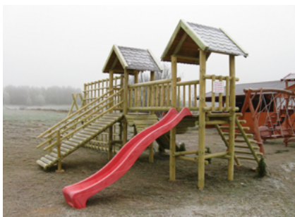
Plac zabaw w Bobrownikach