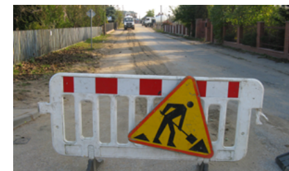
Budowa kanalizacji na ulicy 3 Maja