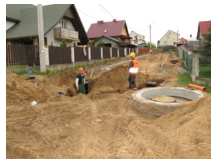
Remont ulicy Jodłowej