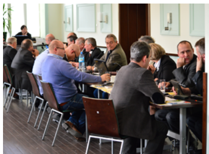
W trakcie obrad Rady Miejskiej w Sokółce

Wyrażam serdeczne podziękowanie dla wszystkich, którzy oddali na mnie swój głos w wyborach 21 listopada. Postaram się jak najlepiej wypełniać obowiązki Burmistrza. Chciałbym