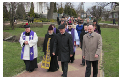
Obchody 1. rocznicy katastrofy smoleńskiej, Sokółka 2011 roku