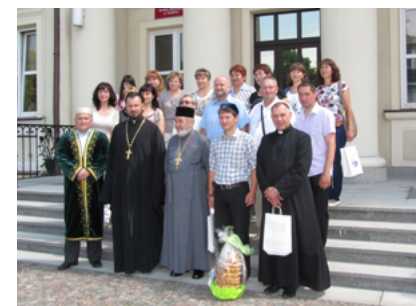
Delegacja z Iwie podczas wizyty w Sokółce w 2012 roku