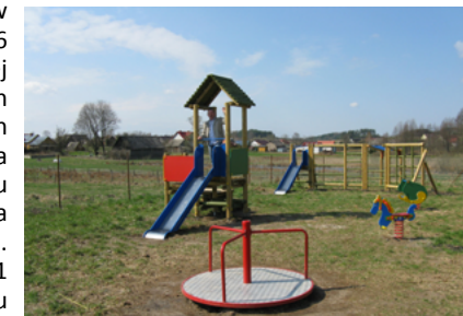
Na nowym placu zabaw w Igrzyłach