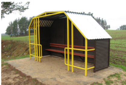
Wiata przystankowa w Miejskich Nowinach