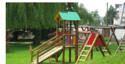
Budowa placów zabaw (Przedszkole nr 1 i nr 2)