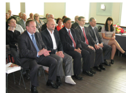
Uczestnicy uroczystości, która odbyła się 16 czerwca 2012 roku w kawiarni „Lira” w Sokółce